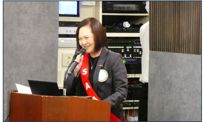
・当日のスケジュール等の確認