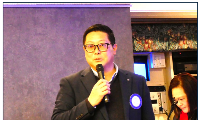
・懇親会についての確認