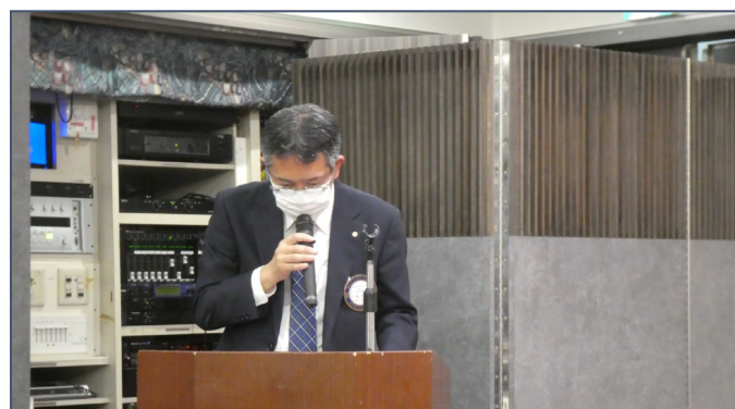
ロータリーの友紹介：西大良会員