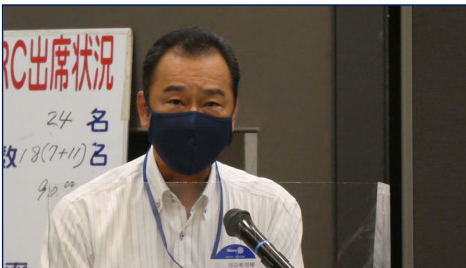
河辺裕司様（厚木警察署長）