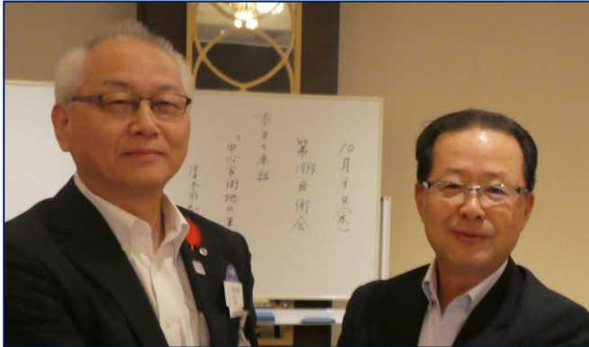
厚木市副市長 霜島宏美様