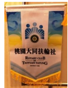
レティからクラブへ。 台湾のお父さんのクラブの 桃園大同ロータリークラブ のバナーです。