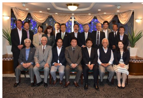
次年度理事・役員・委員長会議@厚木アーバンホテル 2016・4・20