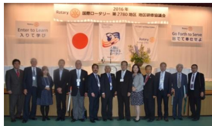
2016-2017 地区研修協議会@相模女子大学 2016・4・17