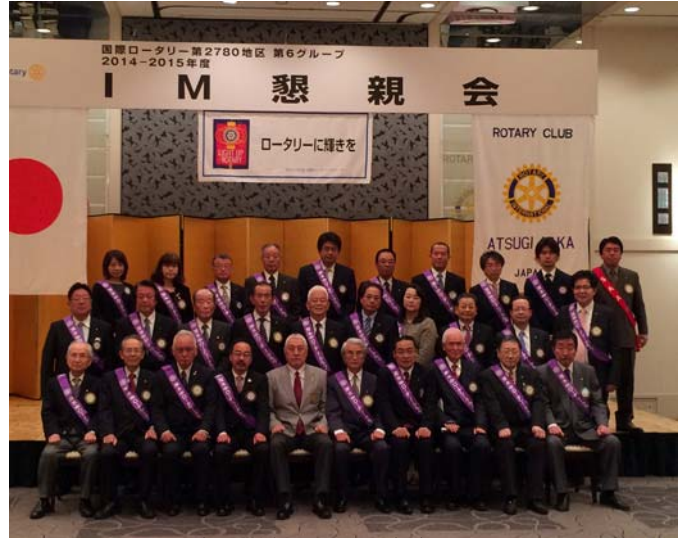
全員揃って記念撮影