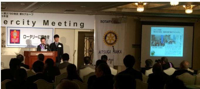
パネルフォーラム「わがクラブ、ここがアピールポイントです」