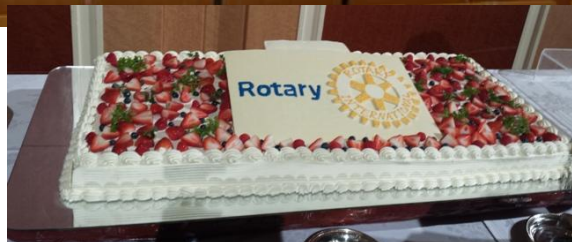
横須賀といえば、ケーキ・・・かな。