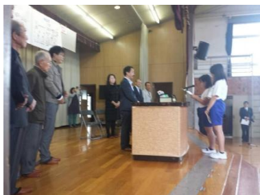
感謝のこぼれを読み上げる大熊の5年生の代表