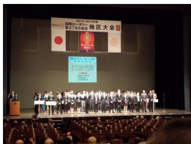
米山奨学生…右奥、後ろにわれらがディズニー君がいました。