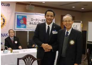
米山奨学生ディズニー君