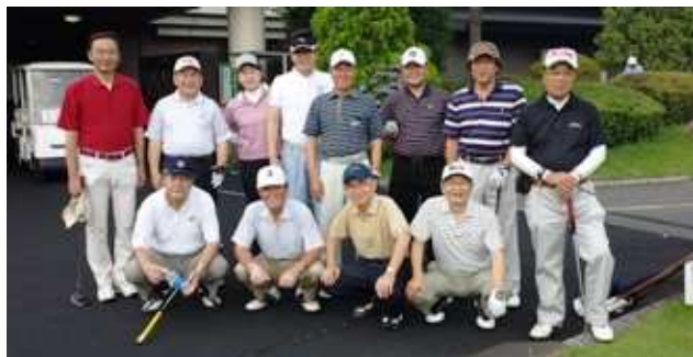
年度末親睦ゴルフコンペ。参加者 13 名。