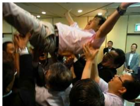
年度末恒例の“会長胴上げ”