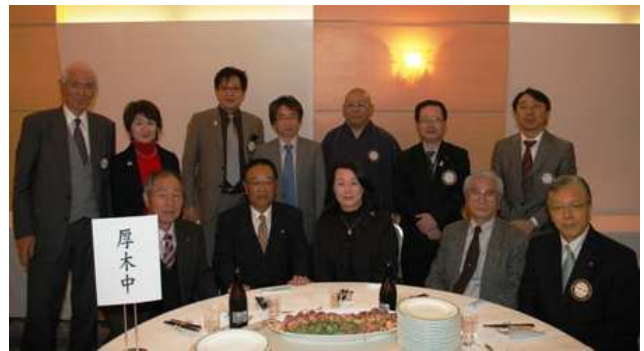
懇親会（早めに帰宅された方も多く全員ではありません）