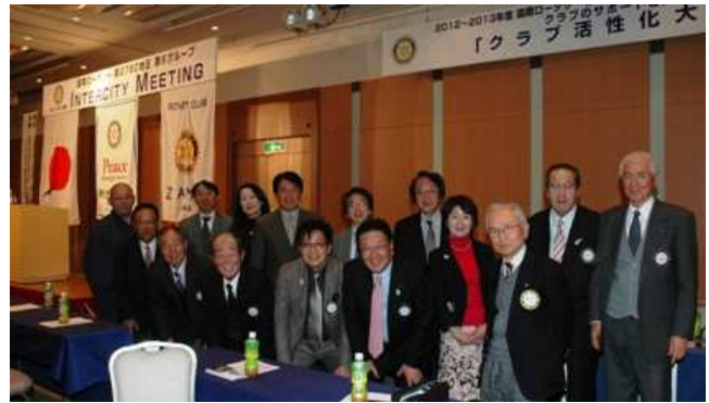
第2部と第3部の合間に記念写真（急いで休憩に行かれた方が多く、残念ながら全員ではありません）