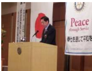
壽永ガバナー補佐挨拶