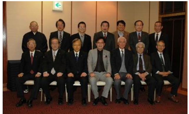
厚木アーバンホテルにて

例会で見た DVD。「モンゴルを緑豊かな国へ」一。韓国ロータリーが2005年ロータリー創立100周年記念で、はじめて5ヵ年事業で黄砂のモトであるモンゴルの砂漠に広範囲の防風林と果実の木を植え、韓国と周辺国家の黄砂被害を減らし、モンゴル地域の住民の生活の質を向上させる事業。ロータリーに出来ないことはない、と感じましたね。